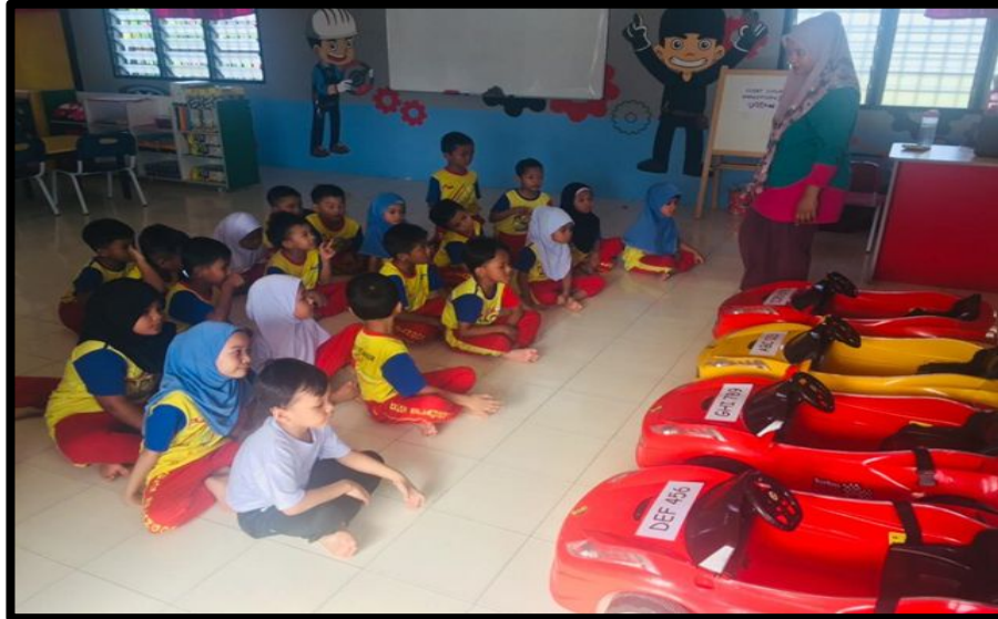
Kanak-kanak berada di pusat pembelajaran