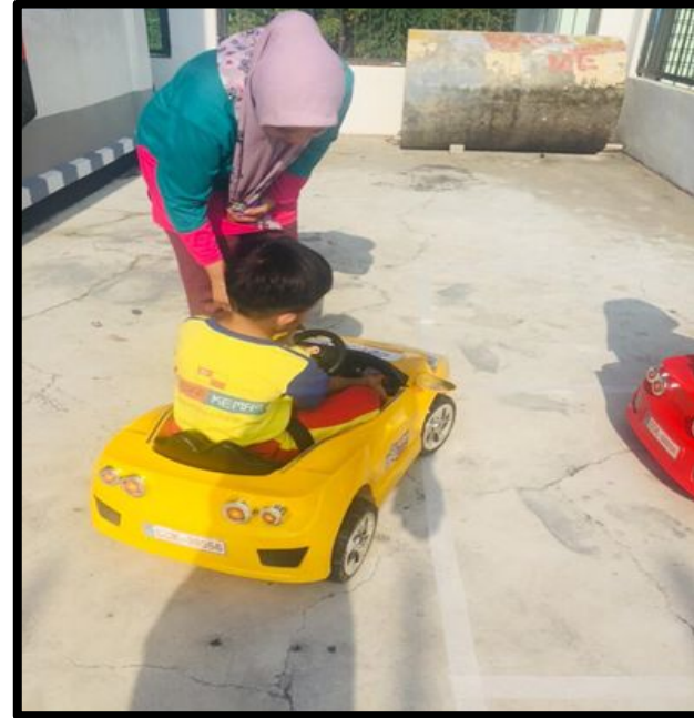
Kanak-kanak diminta untuk masuk ke dalam kereta